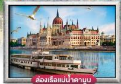
ส่องเรือแม่น้ำดานูบ

พิเศษ!! ลิ้มลองเมนูประจำชาติ ทั้ง 5 ประเทศ!!!