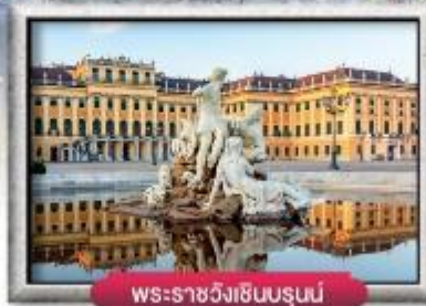
พระราชวังเซินบรุนน์